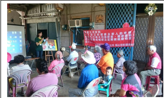
日期: 1060619 地點: 力里關懷據點 活動名稱: 安寧緩和醫療及器官捐贈宣導 人數: 17