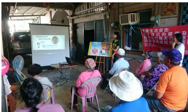
日期: 1060619 地點: 力里關懷據點 活動名稱: 安寧緩和醫療及器官捐贈宣導 人數: 17