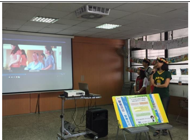
日期: 1060922 地點: 古華關懷據點 活動名稱: 安寧緩和醫療及器官捐贈宣導 人數: 30