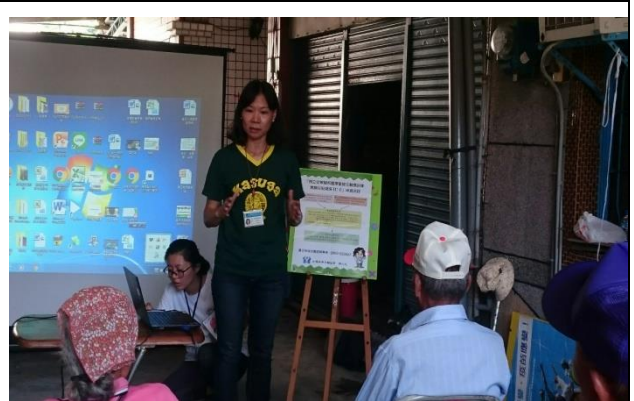
日期: 1060619 地點: 力里關懷據點 活動名稱: 安寧緩和醫療及器官捐贈宣導 人數: 17