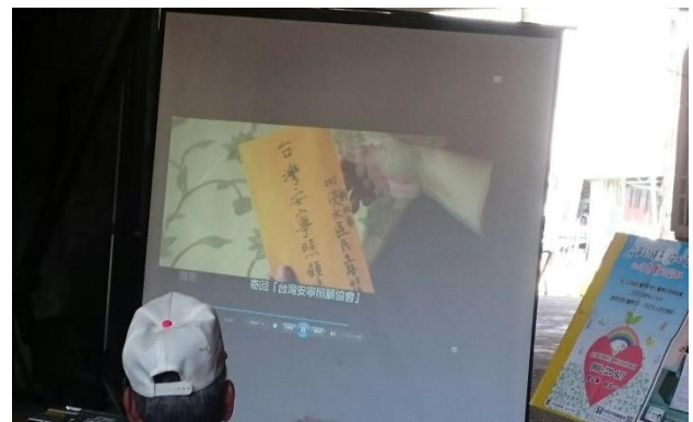
日期: 1060619 地點: 力里關懷據點 活動名稱: 安寧緩和醫療及器官捐贈宣導 人數: 17