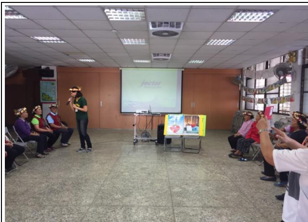
日期: 1060922 地點: 古華關懷據點 活動名稱: 安寧緩和醫療及器官捐贈宣導 人數: 30