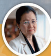
前立法委員 田秋堇