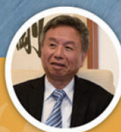
前衛生署長 楊志良

看得見的苦難，容易得到人們的同情 然而，每個苦難的背後，都深藏著制度的問題 醫療要分級、健保要永續、城鄉就醫要公平... 在在都需要醫改基金會持續發聲 但，我們正面臨前所未有的財務危機 需要您以實際行動響應支持 一起為更健康的醫療環境而努力